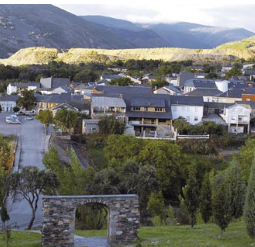
ofrece la posibilidad de acercarse a la naturaleza. CUENYA