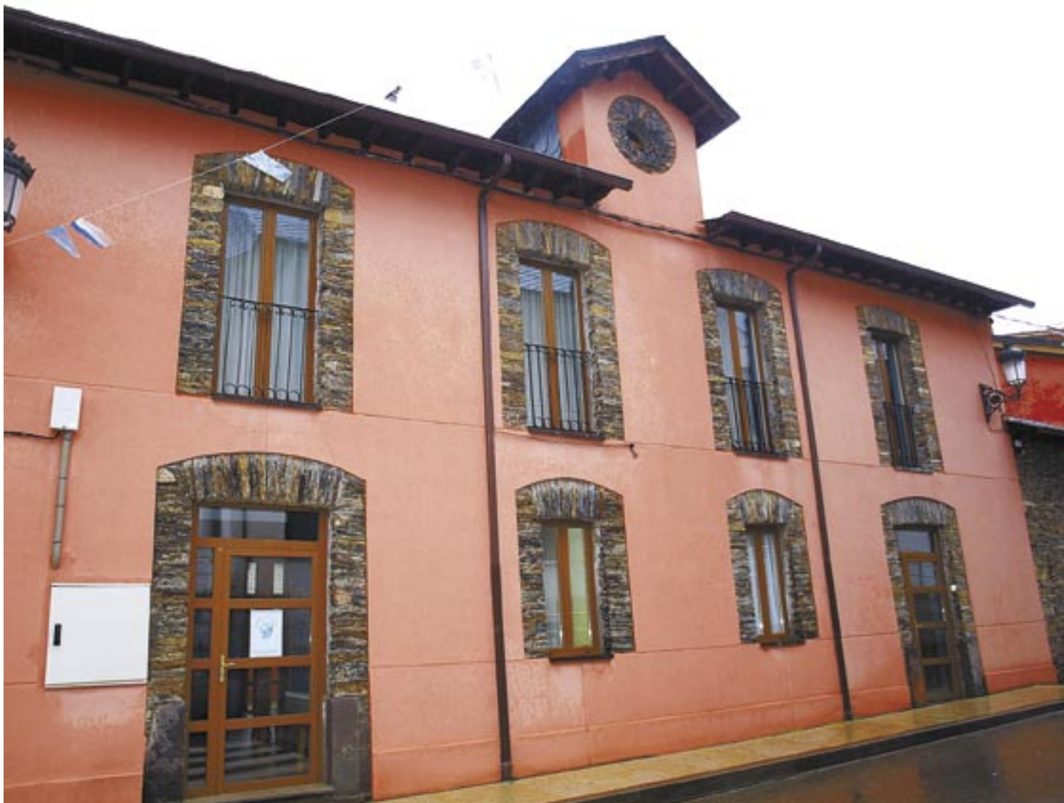
Casa donde vivió Ángel González en Páramo del Sil, que hoy alberga el Centro Rural de Innovación Educativa.