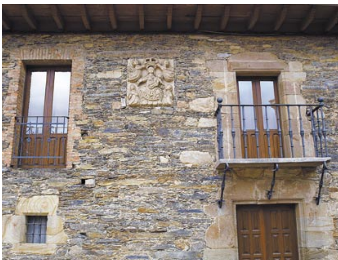
Casa blasonada que se conserva en Páramo. CUENYA