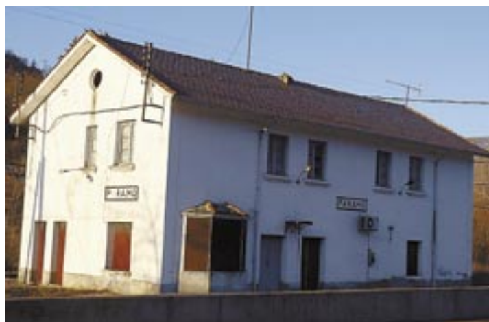
Estación de Páramo, a donde llegó en 1943. CUENYA

Para los amantes de la naturaleza conviene señalar que, hacia el pico Catoute, el excursionista se encontrará con la aldea de Salentinos, en otros tiempos casi deshabitada, y que en estos últimos años ha recuperado, por fortuna, el pulso vi-