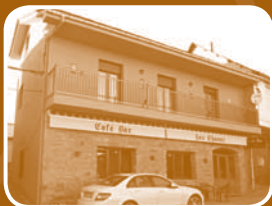
Café Bar Las Chanas Plaza de San Isidro, S/N 24319 Noceda del Bierzo Tel.: 987 51 72 77