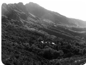
Ferradillo. Al fondo las peñas