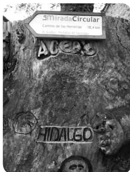
Camino de las Herreñas. El Acebo

La Mirada Circular se planteó como un proyecto de Nivel 1 que tuviera una repercusión y un apoyo estatal. Actuando sobre un territorio de 58 localidades (3708 habitantes) de 19 municipios (111124 habitantes). El patrimonio territorial a conservar con el que se vincula directa o indirectamente son 70 Bienes de Interés Cultural, 150 lugares de Interés Natural, 70 montes de Utilidad Pública, una Reserva de la Biosfera, dos espacios declarados como Patrimonio de la Humanidad y 10 espacios de la RN2000. En cuanto a la recuperación del capital humano se planteó que el proyecto apoyaría a 106 empresas (negocios) con 400 puestos de trabajo y fomentaría 100 nuevas empresas creando 500 nuevos puestos de trabajo.