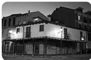
Plaza del Grano en León

Llamazares acaba de publicar un libro de relatos, cuyo título es Tanta pasión para nada.