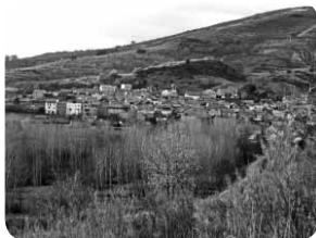
Quintana de Fuseros, borde norte de la cuenca.

grandes cantos en abanicos aluviales en las zonas próximas a las montañas y, que a medida que nos alejamos de las zonas origen de los materiales, del borde montañoso, van siendo progresivamente cada vez más finos, depositándose arenas hasta llegar a los depósitos arcillosos tan comunes en las zonas centrales de El Bierzo. Localmente, alejados de las zonas fuente de materiales y en las zonas centrales de la cuenca y sub-cuencas de El Bierzo, aparecían pequeños lagos y lagunas, en las que se depositaban calizas y carbonatos, tal como se puede ver en las cercanías de Bembibre, al pie de La Corona en los pequeños taludes de la antigua N-VI. Puntualmente, en zonas cercanas a los macizos montañosos, al abrigo de los depósitos de materiales más gruesos, aparecen pequeñas capas calcáreas, tal como se puede ver sobre Quintana de Fuseros.