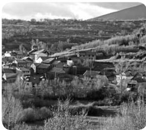
San Justo, ladera suave. Primer plano. Ladera escarpada

Posteriormente, prosiguió la erosión de la cuenca, y llegaron los periodos glaciares, durante los que se excavaron las terrazas que tan bien se aprecian en El Bierzo Alto en los alrededores de Bembibre y que han dejado unos bonitos valles glaciares en el Catoute y sus alrededores, y esta excavación de la cuenca ha dejado visible la base de las arcillas terciarias en la zona del pie del muro del castillo de Bembibre, en el foso, que son unos conglomerados de edad carbonífera.