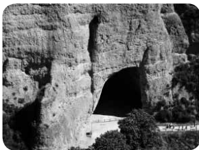
La Cueva en Las Médulas

Pero sobre todo se demostraba que desde lo local se podría acceder a lo global, que desde la periferia se podían construir centros, que era posible conceptualizar: “La Mirada Circular es un proyecto de Turismo sostenible e inteligente” (Grandes Espacios, 2008).