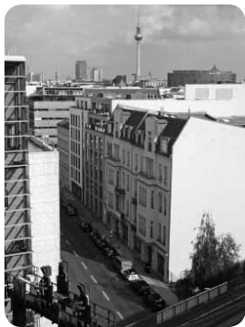
Panorámica de Berlín desde la terraza de TVEspañola

Noceda del Bierzo murió el día en que España ingresó en la Unión Europea. Lo empezaron a matar en los años anteriores en un intento de "adaptar" la agricultura española a los usos europeos. En los años 70 en Noceda del Bierzo cada casa era una granja y una explotación ganadera dirigida básicamente al consumo familiar que "exportaba" sólo los excedentes de leche, de carne (terneros) o de heno. Una situación insostenible a juicio de los políticos de entonces. Y tenían razón: no se podía seguir con