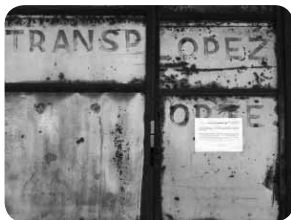
Vestigio de Autos López en Viñales

en Noceda sino en los pueblos vecinos. Y mala pinta no tenía el autobús, como puede verse en esta foto que ilustra el artículo, en la que aparece mi padre junto a su hija, hermana y una amiga un 15 de agosto de 1963.