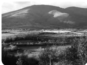
Valle de Noceda. Ladera suave.

Y las primeras en movilizarse fueron las rocas alteradas previamente, con las acumulaciones de oro, que son las que se encuentran hoy en día más cercanas a los relieves elevados, y que tan bien conocían los romanos. También se produjo la movilización de los cantos y arenas que se encontraban en los escasos ríos y arroyos de entonces, cantos principalmente de cuarzo que es el material más duro de los que aparecen en las rocas. Estos materiales se encuentran por ejemplo al sur de Noceda, siendo explotados en la actualidad como áridos para construcción, y en ese lugar también los romanos extrajeron oro.