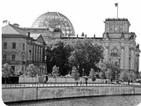
Vista del Reichstag, Alemania

El escándalo ha dado pie en Alemania para que se cuestionen no ya sólo los controles de la fabricación de piensos y de los productos alimentarios, sino también para juzgar un modelo