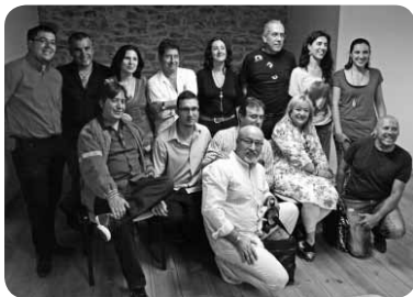
Encuentro Literario en Noceda.

E n el útero de Gistredo, donde canta el urogallo y campa a sus anchas el oso (incluso se zampa las colmenas de Senén y aun otros paisanos), tuvo lugar un Encuentro Literario, que contó con la presencia de narradores y poetas leoneses (alguno hubo de fuera, mas lo acogimos con hospitalidad y placer), acaso en homenaje a aquellos filandones tradicionales o bien al estilo de los poetas románticos reunidos en torno al fuego sagrado de las inspiraciones divino-demoníacas. Véase/léase cómo se gestó el mito de Frankenstein.