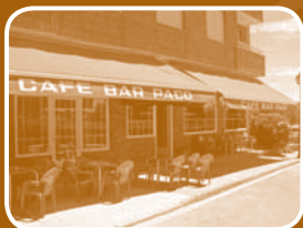
Café Bar Paco C/ Arcos, 28 24319 Noceda del Bierzo Tif.: 987 517 158