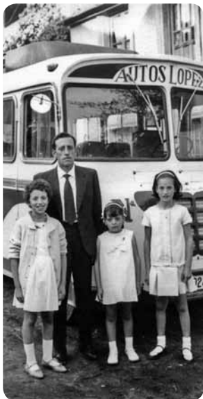
Familia Arias con una amiga en Noceda

Las cadenas han sido sus indispensables compañeras de viaje. No podemos dejar de imaginar la infinita paciencia que ha tenido con tantas vacas, los rebaños de ovejas, los carros llenos de hierba o de cualquier otra cosa, cada 16 de agosto, San Roque, tempranita la mañana cuando le obligábamos a parar los festejeros que íbamos pidiendo huevos para el ponche... Y sobre todo paciencia, con la cantidad de gente que ha tenido que tratar a diario. Dice que notó el bajón de pasajeros en los años 70, y que una vez en Bembibre sufrió un robo de 7.000 pesetas que estaban destinadas para gasolina, pero en general él no tiene queja de las personas. "Siempre traté con buena gente". Nos alegramos, y para los que somos unos bichos raros por no tener coche, seguiremos viajando en el cochelínea.